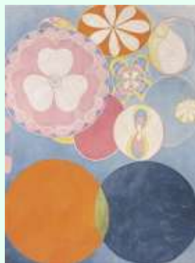
H.af Klint, Volwassenheid no. 2 (1907)

Piet Mondriaan (1872-1944) en de Zweedse kunstenares Hilma af Klint (1862-1944) worden beschouwd als de belangrijkste pioniers van abstracte kunst. Pas in 1987 werd Klint naar aanleiding van de tentoonstelling 'The spiritual in Art: Abstract painting' enigszins bekend. Door de recente overzichtstentoonstellingen 'Hilma af Klint, paintings for the Future' (2018 Guggenheim New York) en 'Hilma af Klint & Piet Mondriaan, Levensvormen' (2023 Tate Modern en Kunstmuseum Den Haag), is ook zij niet meer weg te denken uit de kunstgeschiedenis.